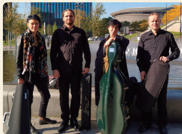
ポーランド・エヴォリューション弦楽四重奏団

*本冊子に掲載されている内容はすべて予定です。都合により一部変更となる場合がございますことを予めご了承ください。