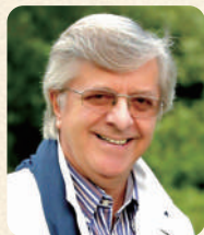
ピョートル・パレチニ