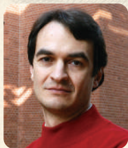
フィリップ・ジュジアーノ