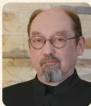
ヴォイチェフ・シフィタワ