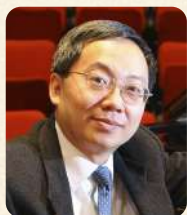
ガブリエル・クウォック