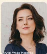
カロリーナ・ナドルスカ