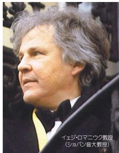
イエジ・ロマニウク教授 (ショパン音大教授)

どのような曲でもそうですが、特にショパンは音色が大事。そのためには身体をリラックスさせ効率よく力を使う必要があります。今回はその秘訣を本場ポーランドのロマニウク教授がショパンの曲を交えて伝授します。講座の後にはコンクール課題曲で公開レッスンも！ちょっとしたコツで音色が変わり、表現の幅も広がりますよ！